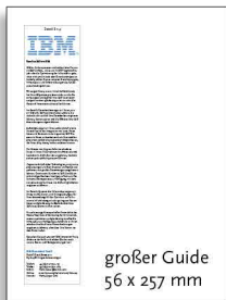
großer Guide 56 x 257 mm