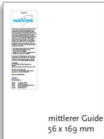
mittlerer Guide 56 x 169 mm

56 x 257 mm, 4c € 1.250,- exkl. MwSt. Kurzprofil und/oder Angebots- bzw. Ausstellertext max. 2.300 Zeichen *)